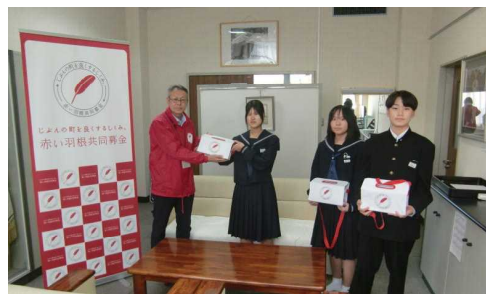
↑ 社会福祉協議会へ募金を寄贈