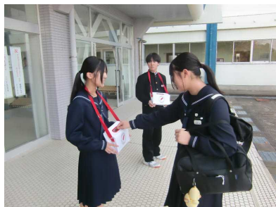
↑ 朝の募金活動の様子 ↑

さて、間もなく師走を迎えます。2025年も残すところあと1か月。時の流れは本当に早いものですね。寒さも厳しくなってきました。生徒の皆さん、保護者の皆様、かぜやインフルエンザなどの感染症に気を付け、元気に年末をお過ごしください。